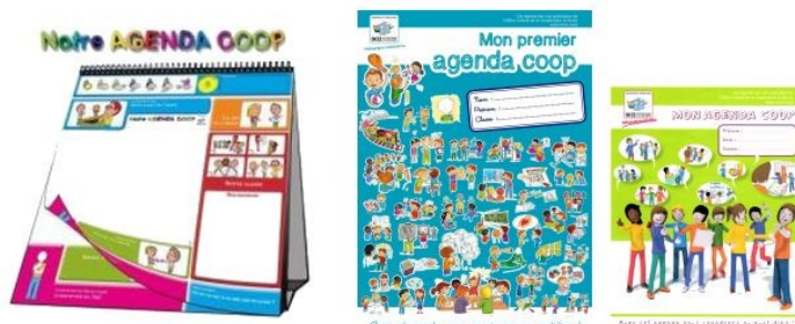
Un agenda et des activités adaptées pour chaque cycle

-La mise en place d'un conseil d'école sur le temps CLAE serait un vrai plus. Il aurait été complémentaire au conseil de classe.