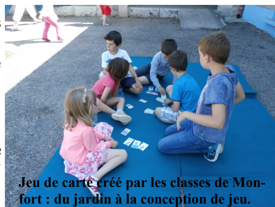
Jeu de carte créé par les classes de Monfort : du jardin à la conception de jeu.

A travers l'expression de « famille botanique », il a été fait le lien en classe avec le principe du jeu des 7 familles. Les élèves de cycle 3 ont ainsi débuté un premier jeu et ont créé un premier jeu de cartes.