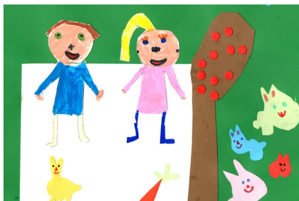
Couverture de « Surprise Partie », création des écoles de Beaumarchés, Saint Elix Theux et Marsan

En synthèse, une expérience à renouveler, développer, diffuser, partager....autour de soi !!! Personnellement, j'en ai parlé avec enthousiasme dans mon école et en conseil d'école, car ce projet mérite une très large diffusion à tout point de vue ! Bravo à l'équipe de l'OCCE pour cette initiative et pour l'organisation conséquente et ... parfaitement bien pensée !